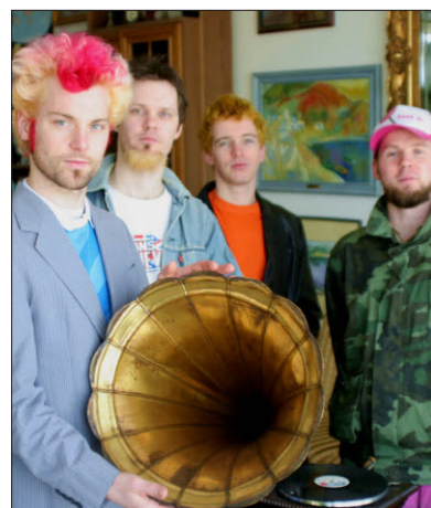
Im Exil: Die Band „Remember“.

Städte – Budapest, Sopron oder Debrecen. Doch es kommt der Zeitpunkt, an dem ambitionierte Bands an die Grenzen der Möglichkeiten im eigenen Land stoßen – wie die Rockband „Remember“. Vor zehn