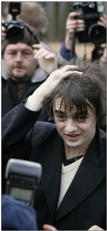
Verwirrend: Pete Doherty.

Montagnachmittag brachten die Nachrichtenagenturen ein wenig Klarheit in die Frage nach seinem Verbleib: Pete Doherty, berichtete die „Associated Press“, sei am Samstagabend in London wegen des Verdachts auf Drogenbesitz festgenommen worden. Die Polizei hätte einen anderen Autofahrer zum Anhalten aufgefordert, dann habe jedoch Doherty gestoppt. Den Beamten sei sein Benehmen auffällig vorgekommen, er sei vorläufig festgenommen worden. Gerücht Nummer wäre damit ausgeräumt: Unter Arrest stand Doherty demnach erst, als er schon längst in Graz hätte sein sollen. Bleibt nur die Flucht in ein neues Gerücht: Vielleicht hat der zuverlässige Verwirrer ja am Samstagabend in Ostlondon die Autobahn nach Graz gesucht.